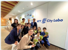
NTT-city Laboへ 最先端の技術を学ぶ