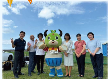
姉妹都市の北海道小平町へ 小平町議員との意見交換も