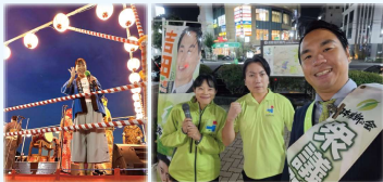
その他、様々な地域のお祭りへの参加や活動報告会の実施、遠方への行政視察も。 各活動の詳細はホームページやSNSでも発信しているので、ぜひご覧ください。