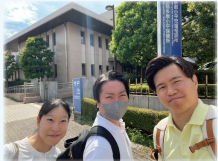
近隣市議と小平児童相談所へ 児童虐待・一次保護の調査