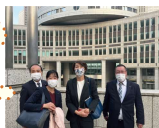
都庁で立体化勉強会