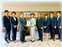
▲予算要望を市長へ提出 市民の皆さんのお声をまとめ R5年度予算要望として提出