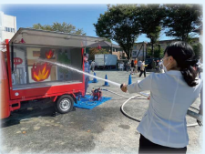
▲総合防災訓練に参加