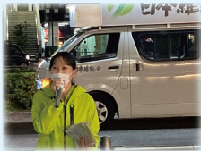
▲街頭活動も実施中！