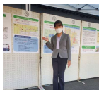
市でオープンハウス開催