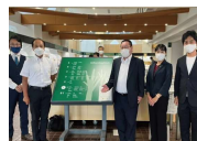
立体化工事中の東村山市視察