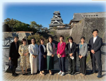
▲視察：熊本「赤ちゃんポスト」杉並区 児童養護施設等 超党派での先進事例視察として熊本県へ 市内でも設置検討中の赤ちゃんポスト・震災復興を視察 他、児童養護施設や最新介護用品についての視察にも