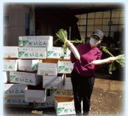
▲援農ボランティア